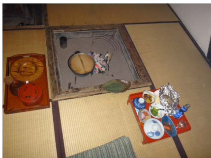
囲炉裏でイワナを焼く超豪華夕食

に入れて受付に行くと、部屋備え付けの封筒に入る財布などは明朝の帰りまで預かってもらえるが、それ以外は入浴の間だけ預かってくれるとのこと。さすが秘湯です。浴衣に着替えて、白湯、黒湯、中ノ湯、露天と温泉のフルコースを堪能しました。