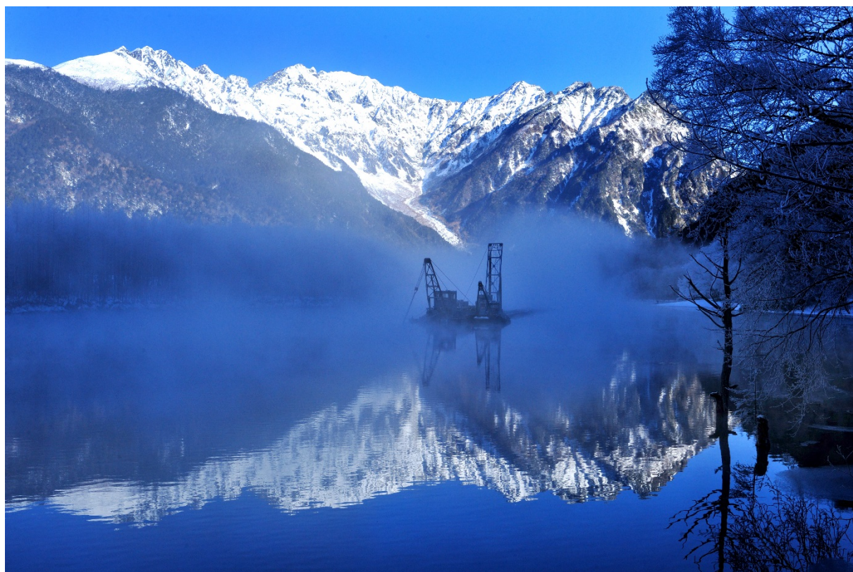
朝霧に霞む大正池：さてこの構図から何が読み取れるのでしょうか